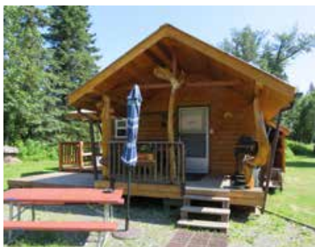
Cabin mit Blick zum Fluss