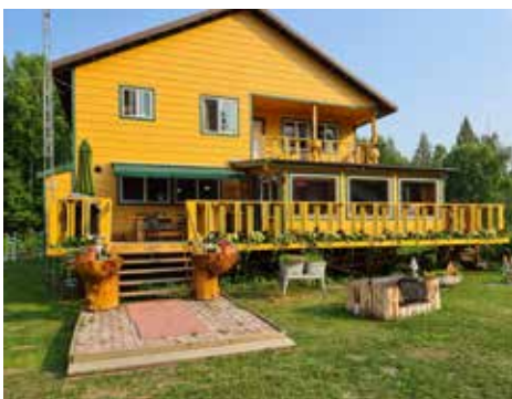
Haupthaus mit Lodge-internem Restaurant

Sockety: mitte Juli bis ende Juli Silver: ende Juli bis ende August